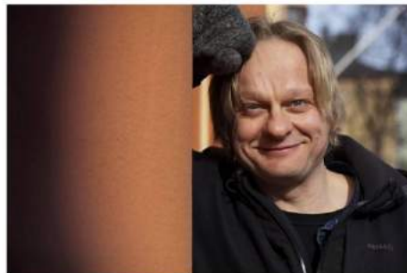
Pianisti Jiri Rantala tuo Berliiniin juhannuksena tangoshow'n.

Berliinin Filharmoniaan on luvassa suurkonsertti