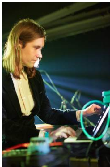
Scope-festivaali