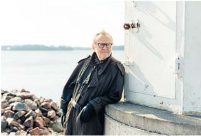
Johan Bargum