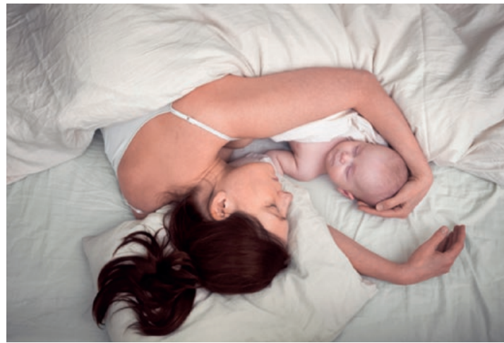
Aino Kannisto Untitled (Woman with Baby Sleeping) 2017