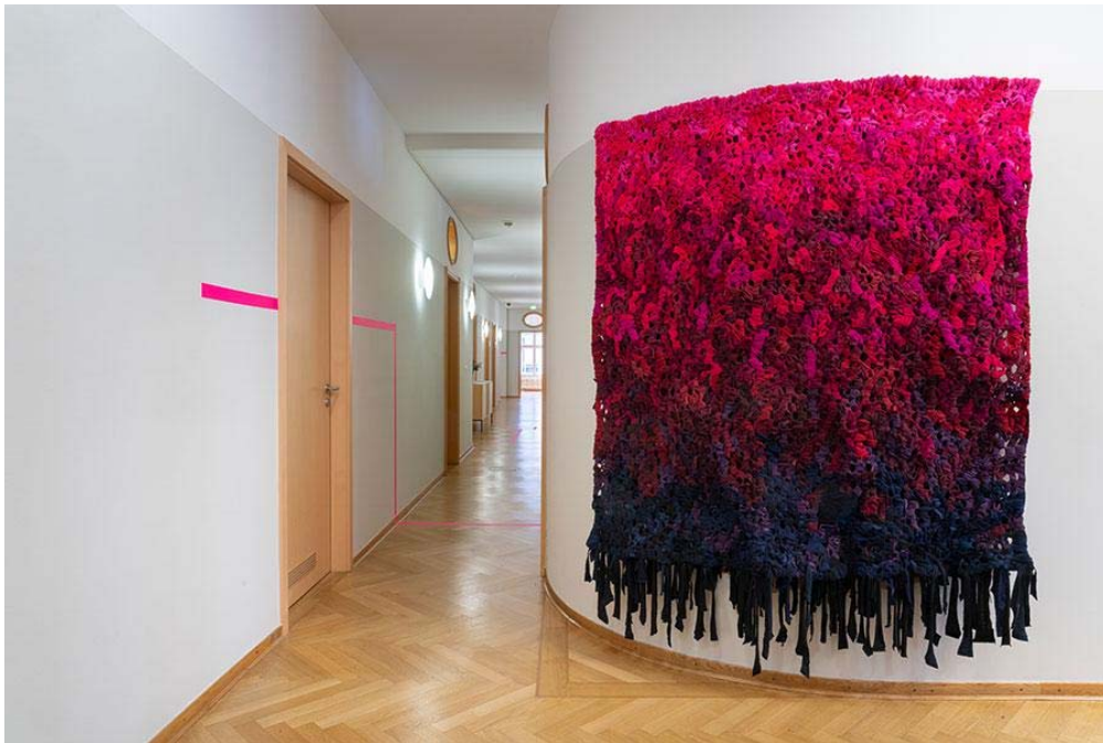
Installation © Finnland-Institut, foto: dotgain.info