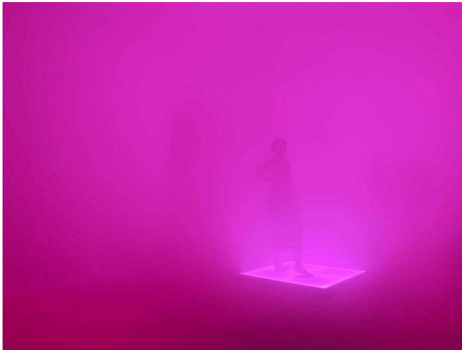
Hide and seek , Custom-made weight-sensored light tiles, fog, LEDs | Specialtillverkade viktkänsliga ljusplattor, dimma, LED-lampor, 40–50 m 2 (2021)